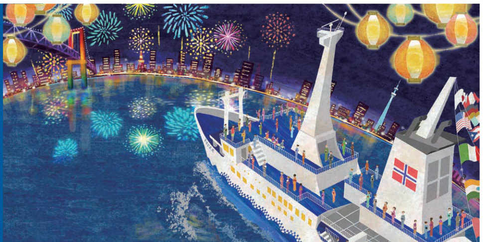
Illustration By Yoko Yabugami