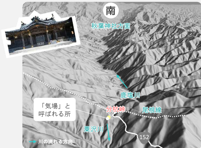
分杭峠と南の谷の様子 地理院地図より作成